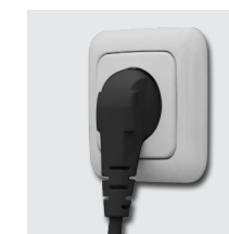
Vor Gebrauch Netzstecker einstecken