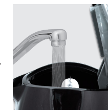
Ausschließlich mit kaltem Wasser füllen und den Deckel schließen