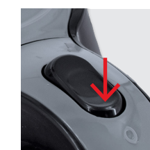
Der Wasserkocher schaltet sich automatisch aus