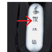
Nicht über die MAX -Markierung hinaus befüllen