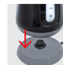
Wasserkocher auf den Heizsockel stellen