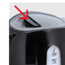
Deckelentriegelungstaste drücken und Deckel öffnen