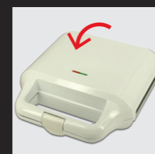
Deckel schließen und verriegeln