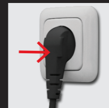
Vor Gebrauch Netzstecker einstecken