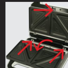
Platten entfernen und gewünschte Platten montieren