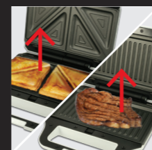
Deckel öffnen Sandwich oder Grillgut herausnehmen