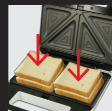
Belegte Toastscheiben auf die Sandwichplatte legen