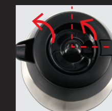
Zum Öffnen Deckel um 90° verdrehen und abnehmen