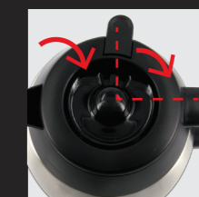
Zum Schließen Deckel versetzt auflegen und um 90° verdrehen