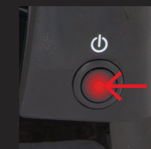
Kaffeemaschine einschalten und Betriebsindikator leuchtet auf.