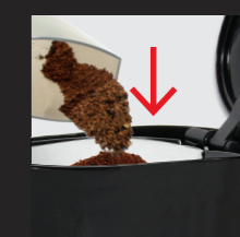
Gemahlener Kaffee in den Filter geben.