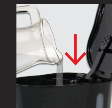
Wasserbehälter mit kaltem Wasser füllen