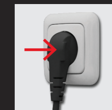
Vor Gebrauch Netzstecker einstecken