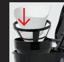
Papierfiltertüte in den Filterhalter einsetzen.