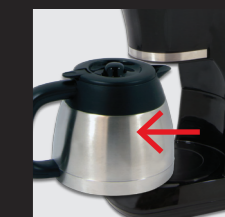
Isolierkanne nach dem Brühvorgang entnehmen und Kaffee ausgießen.